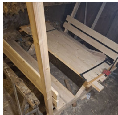
Rohbau unserer neuen Sitzgruppe

Die Fortführung des Veranstaltungsflyers wollen wir auch gern im neuen Jahr fortsetzen und sind da auf die Mitarbeit aller Einwohner, Vereine und Händler angewiesen. Zusätzlich planen wir im Jahr 2025 die Erstellung einer Infobroschüre über Langenchursdorf. Gerne können Sie sich bei Fragen, Anregungen und