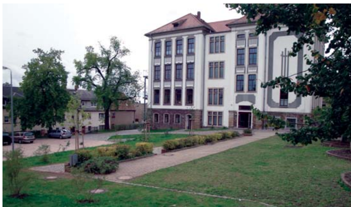
Neues Domizil für die fünften und sechsten Klassen: die ehemalige Pestalozzi-Schule.

Die zahlreichen Unbekannten vor dem Start ins neue Schuljahr lösen sich langsam auf. Für alle Beteiligten und vor allem für die Pädagogen der Sachsenring-Mittelschule war die Startphase ins Schuljahr 2011/12 auch eine Testphase. Wird der zwischenzeitliche Umzug der Klassen 5 und 6 in das Gebäude der ehemaligen Pestalozzi-Schule (Hermannstraße) gelingen? Kommen alle Schüler mit den neuen Busfahrplänen und den öffentlichen Bushaltestellen zurecht? Welche Probleme wird es bei der Nutzung der Sportstätten geben, die nunmehr zum Teil per Fuß erreicht werden müssen? Jetzt ist klar: Für viele Sorgen gab es Entwarnung, aber eine riesige Umstellung für Lehrer und Schüler bleibt es trotzdem. Es ist eben ein Unterschied, ob man in einen Bus gesetzt wird, oder ob man zur Sportstätte läuft. Viele „Fünfer“ mussten erst lernen, wie man sich auf diesem Weg verhält. Wert wurde auch auf die weitere Verbesserung der materiellen Gegebenheiten an der „neuen“ Schule gelegt, so erfolgte beispielsweise die Anbringung von Lamellenvorhängen in einem Teil der Unterrichtsräume. Andererseits stehen noch viele – oft kleinere – Wünsche offen, die aber wesentlich zur Anhebung des Niveaus vor Ort dienen könnten. Der ständige Kontakt zu den Verantwortlichen der Kommune soll dafür sorgen, dass es regelmäßig Verbesserungen am neuen Schulstandort gibt.