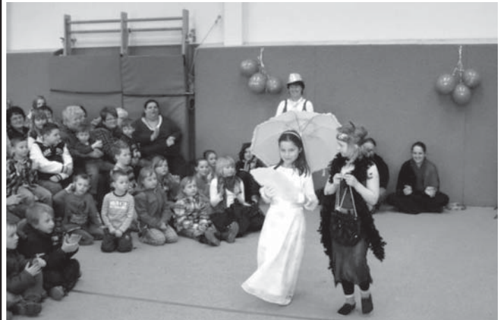
Modenschau zur Schulfesteröffnung