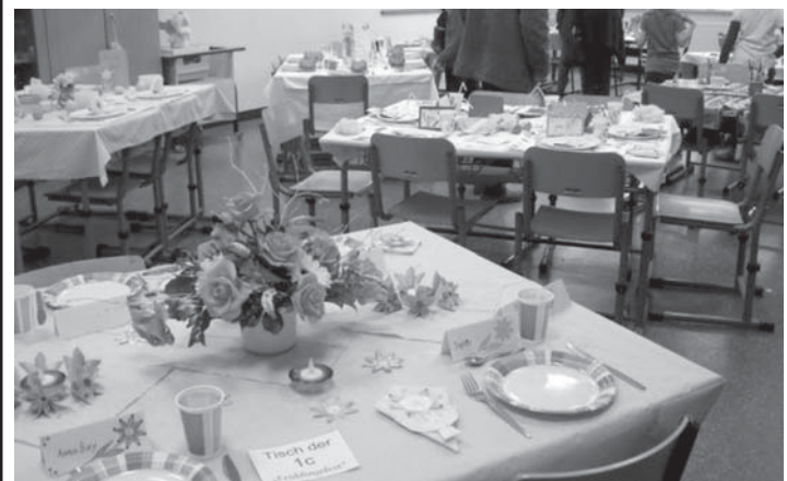
Der perfekte Tisch – Klassensiegetische