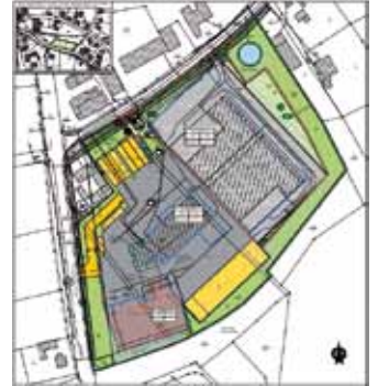
2. Änderung des Vorhaben- und Erschließungsplanes zum vorhabenbezogenen Bebauungsplan Spedition Prüstel GmbH

Beschlussfassung über den Bauleitplan unberücksichtigt bleiben, wenn die Gemeinde den Inhalt nicht kannte und nicht hätte kennen müssen und deren Inhalt für die Rechtmäßigkeit des Bebauungsplanes nicht von Bedeutung ist (§ 3 Abs. 2 BauGB)