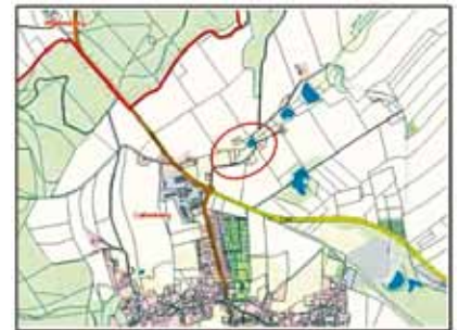
Außenbereichssatzung „Spielsdorf“ in Callenberg

SächsGemO genannten Frist jedermann diese Verletzung geltend machen. Sätze 1 bis 3 sind nur anzuwenden, wenn bei der Bekanntmachung der Satzung auf die Voraussetzungen für die Geltendmachung der Verletzung von Verfahrens- oder Formvorschriften und die Rechtsfolgen hingewiesen worden ist.