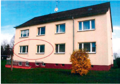
Eigentumswohnung Altenburger Str. 23

Rathausstr. 40, 09337 Callenberg Tel.: 03723/69996-0; 69996-31, Fax: 03723/ 699 9666 E-Mail: mueller@callenberg.de Homepage: www.callenberg.de