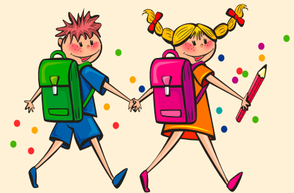
Klasse 1 a mit der Klassenlehrerin Frau Grabosch